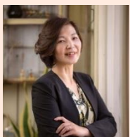
B-GROOW登録講師 みらいアクション代表 研修講師・コーチ

初回シリーズの今回のテーマは、メンバーのやる気スイッチを入れるコミュニケーション術! 明日からすぐに使える内容になっております。皆様のご参加をお待ちしております!!