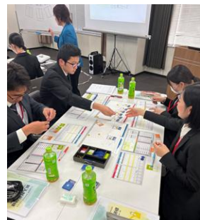
ビジネスゲームではそれぞれの戦略でプレイします。利益がでますよう！