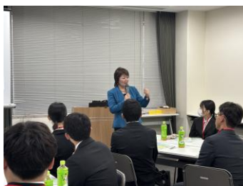
研修スタート！緊張感が漂います。

研修には13名様にご参加いただきました。受講生の皆さまはコミュニケーション力が高く、グループワークやペアワークでも活発に意見交換をされていました。