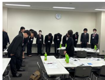
さまざまなお辞儀があることを学びます。